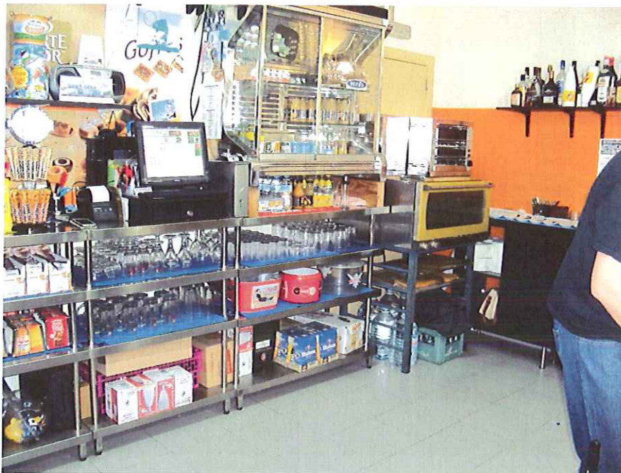
Zona interior barra.