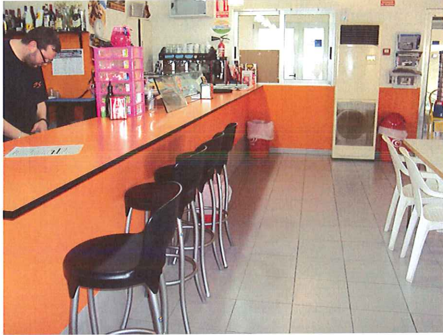
Zona exterior barra.