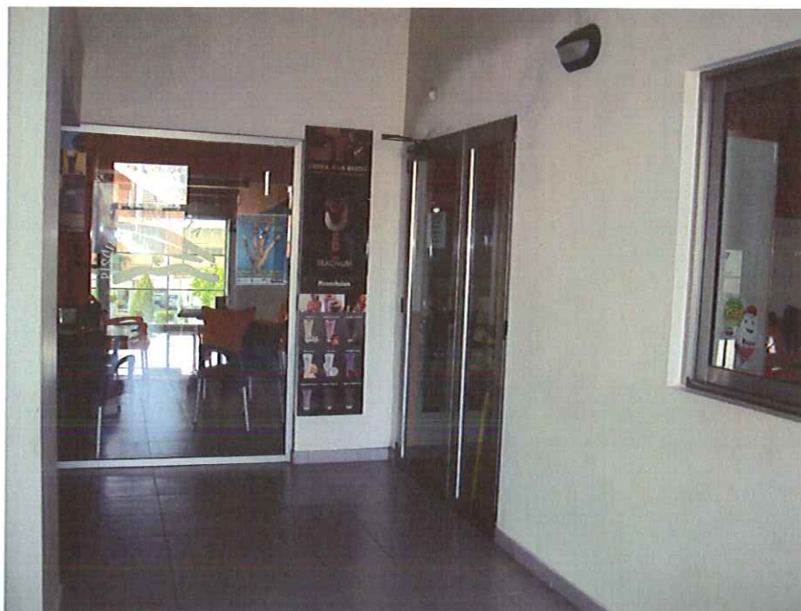
Acceso a la cafetería.