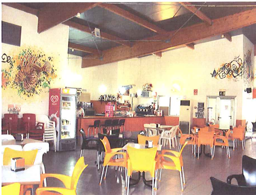
Vista general de la cafetería.