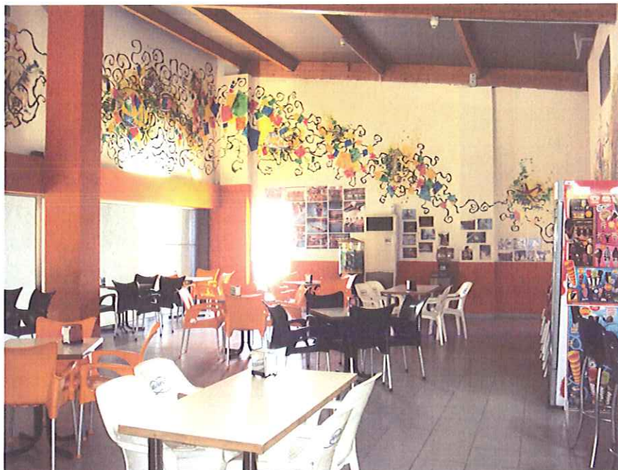
Vista general de la cafetería.