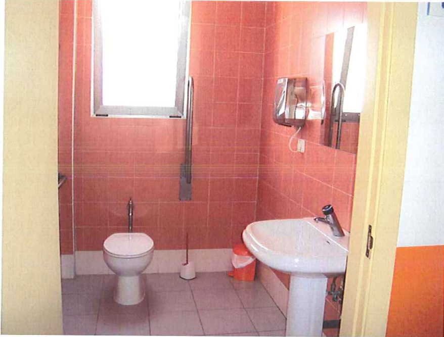
Aseo adaptado a personas con movilidad reducida.