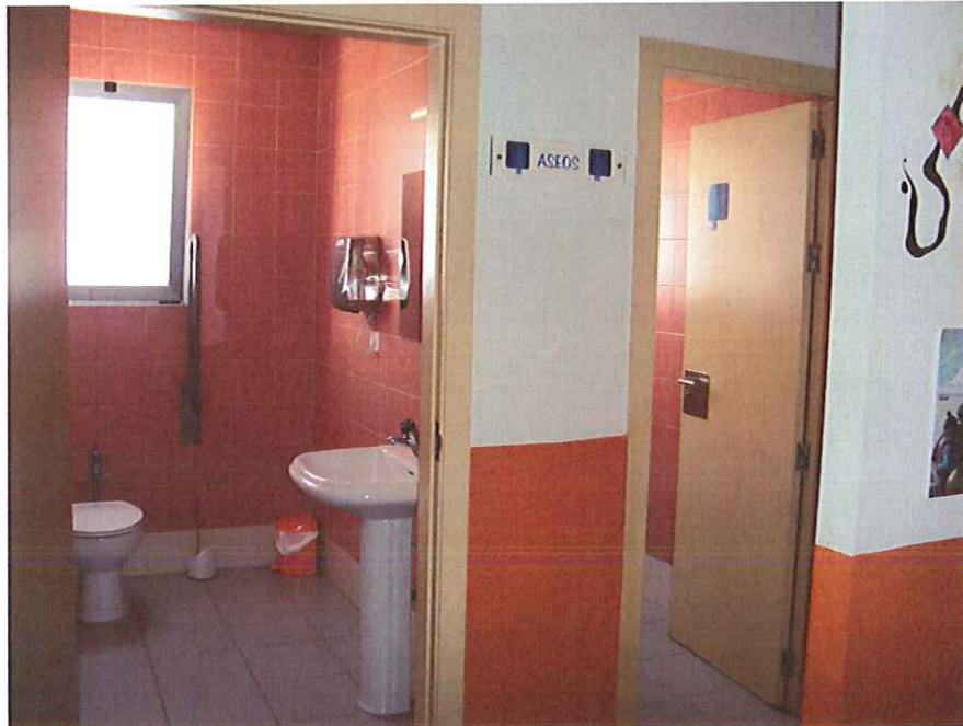
Zona de paso a aseos